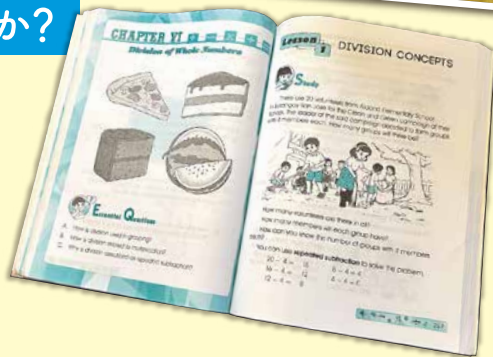
実際に使われている教科書

フィリピン・ミンダナオ島ダバオ市周辺の小学校で、 英語で算数を教える教育活動に参加するボランティアを 募集します。活動先は、日本と長年交流のある親日校です。 ダバオはフィリピンで最も治安のよい地域の一つで、 初めての海外ボランティアにも適しています。