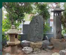
インターナショナルの 散骨墓