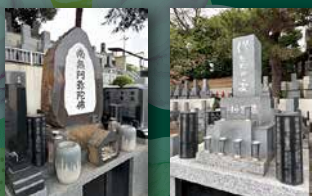
お墓のマンション やすらぎの墓