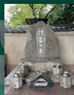
残された人が お参りできる散骨墓